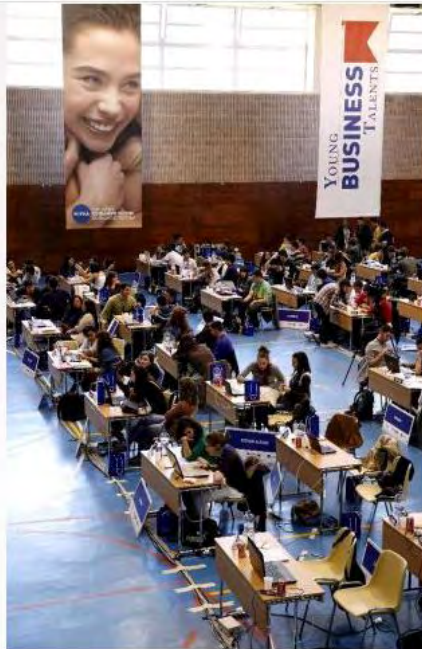
Murcia es una de las comunidades con más centros docentes inscritos para participar en el Young Business Talents 2012

De los 234 centros de toda España inscritos en la competición, un total de 15 son murcianos