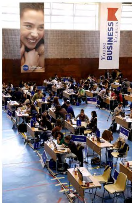
BARCELONA, 20 (EUROPA PRESS)

Catalunya es la comunidad con más centros docentes inscritos en el concurso Young Business Talents 2012, que organizan Beiersdorf-Nivea y Praxis MMT, en que los alumnos compiten por convertirse en los mejores empresarios virtuales de España y ganar parte de los 21.000 euros en premios, han informado los impulsores de la iniciativa en un comunicado.