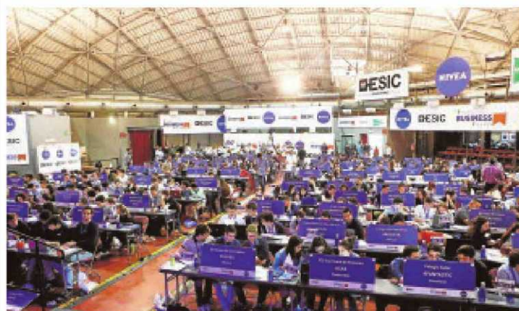
Un grupo de estudiantes, durante la selección del programa educativo de simulación empresarial Young Business Talents

tras siete años como el único proyecto de gamificación práctica y empresarial presente en los centros docentes. De esta forma, permite a los jóvenes dirigir sus propias empresas en internet con el uso de simuladores virtuales.